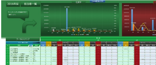
担当者分析 (上司用)